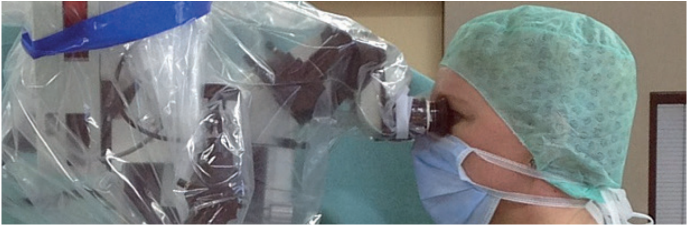
Mikrochirurgischer Eingriff: Der Operateur blickt durch ein OP-Mikroskop

Nach der Operation können die Patienten zügig ohne Hilfsmittel mobilisiert werden und nach wenigen Tagen die Klinik wieder verlassen. Die Ischiasschmerzen sind regelhaft sofort rückläufig. Je nach Ausmass einer eventuell schon vorhandenen Nervenschädigung, sind auch Ausfallserscheinungen sehr schnell rückläufig.