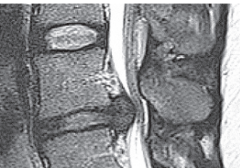
MRT- Untersuchung mit Darstellung eines Bandscheibenvorfalles an der Lendenwirbelsäule

scheibe ist schmerzhaft, sondern die Schmerzen entstehen vor allen Dingen dann, wenn das Bandscheibengewebe auf umliegende Nervenwurzeln drückt (Nervenwurzelkompression). Dies kann bei einem Bandscheibenvorfall