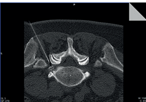
Computertomographisch unterstützte Spinalnervanalgesie

Sofern keine neurologischen Störungen (Taubheit, Lähmungen) vorliegen, muss ein Bandscheibenvorfall nicht operiert werden. Nicht operative Behandlungsmöglichkeiten bezeichnet